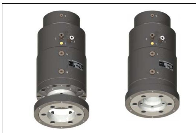
Fig. 1: Fissaggio verticale per PowerStroke FSK

Per evitare le forze vincolari che agiscono in modo trasversale sulla barra è spesso consigliabile fissare il PowerStroke FSK con il fissaggio verticale per FSK al telaio della macchina senza serrarlo, affinché i movimenti trasversali non influiscano sulla barra. Nella versione FSK-SVE per barre che devono essere inserite o estratte, con l'installazione verticale è necessario utilizzare il fissaggio verticale per FSK per il montaggio nella macchina o nell'impianto.